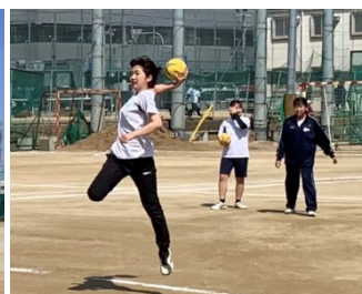
現役の練習風景(男子部)