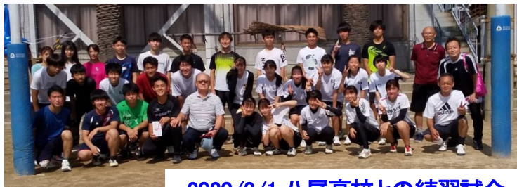
2020/8/1 八尾高校との練習試合