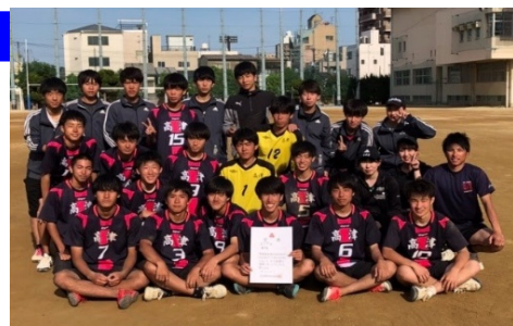
写真@大阪府南地区大会: 最前列で表彰状を持っているのが私です。