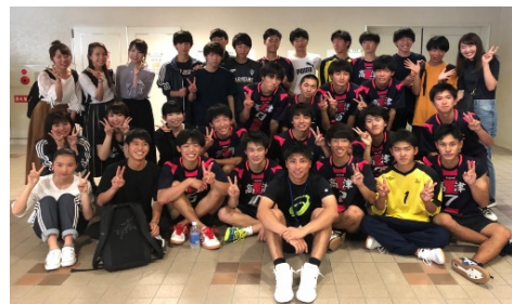
写真@中央大会 1 回戦後: 最前列右から 3 番が私です。